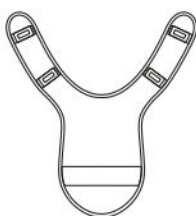
vnt 1280 Накладки ножные «Комфорт»