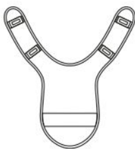
vnt 1280 Накладки ножные «Комфорт»